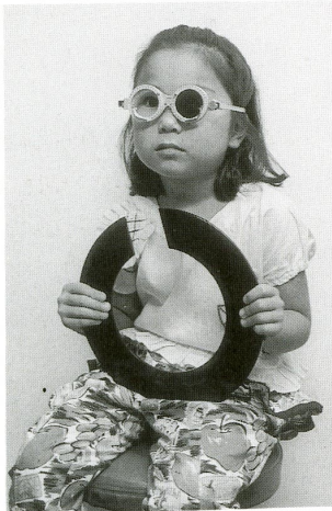
ハンドルを使用した幼児の視力検査 視能矯正マニュアル P4