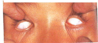
斜視と眼球運動異常 P80